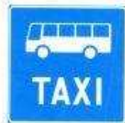
Полоса для автобуса (знак над полосой)