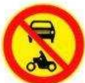
Движение механических транспортных средств запрещено