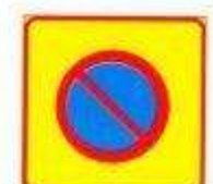
Территориальное запрещение стоянки