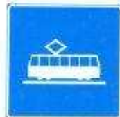
Полоса трамвайной линии (знак над полосой)