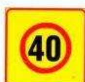
Территориальное ограничение скорости