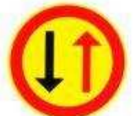
Преимущество встречного движения